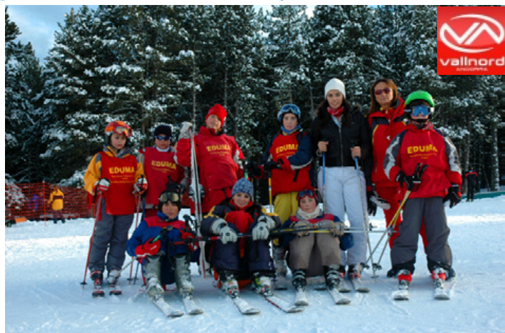
Eduma Agrupación Deportiva.

REQUISITOS : Rellenar ficha de inscripción - 1 fotografía - autorización paterna para los menores de edad y tener o concertar con el Club un seguro de accidentes de esquí y asistencia.Se requiere pasaporte o D.N.I. + autorización paterna para menores de edad en Andorra y Francia.